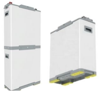
48V 200AH CON PUERTO DE COMUNICACIONN PACK