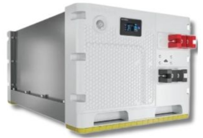
24V 200A CON PUERTO