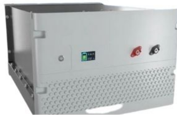
48V 200AH CON PUERTO DE COMUNICACION